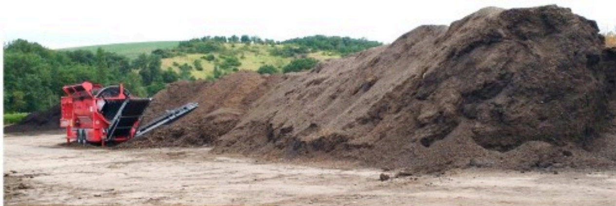
Photo de cribleur et d'un lot de compost fini sur la plate-forme de St-Léon

Depuis le 1 er janvier 2016, SEDE a repris le site de compostage TRANS VERT créé par M. De Biasi. Ce site situé chemin de la Fourcade, à Saint-Léon a été rebaptisé "Lauragais compost".